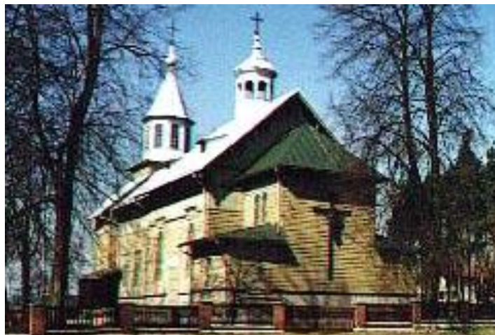
Rysunek 2 KOŚCIÓŁ PARAFIALNY