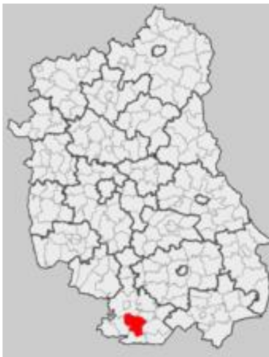
Rysunek 1 Położenie gminy Księżpol w województwie lubelskim

Miejscowość Zanie położona jest w Gminie Księżpol , w województwie lubelskim, w powiecie biłgorajskim, w odległości ok. 12 km od Biłgoraja. Gmina Księżpol leży w regionie typowo rolniczym, na pograniczu Płaskowyżu Tarnogrodzkiego i Równiny Biłgorajskiej, nad rzeką Tanwią.