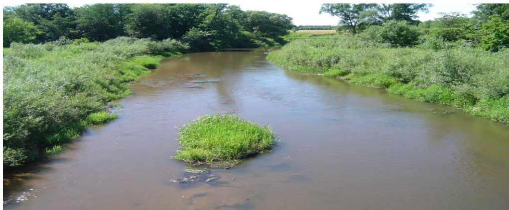
Rysunek 4 Rzeka Tanew.

przebiega czarny szlak pieszy (walk partyzanckich) ciągnący się z miejscowości Bidaczów do Tomaszowa Lubelskiego.